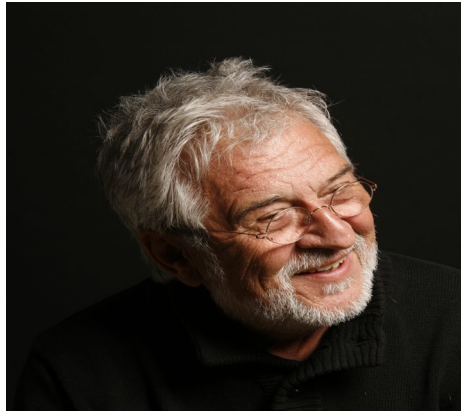
Δρ Γιώργος Μαυρογιώργος Ομότιμος Καθηγητής Πανεπιστημίου

Οι ρευστές ταυτότητες των εκπαιδευτικών στην ελληνική εκπαίδευση και κρίσιμα επεισόδια διαπραγματεύσεως και πάλης: μια «διαβίου»/ιστορικοβιογραφική προσέγγιση